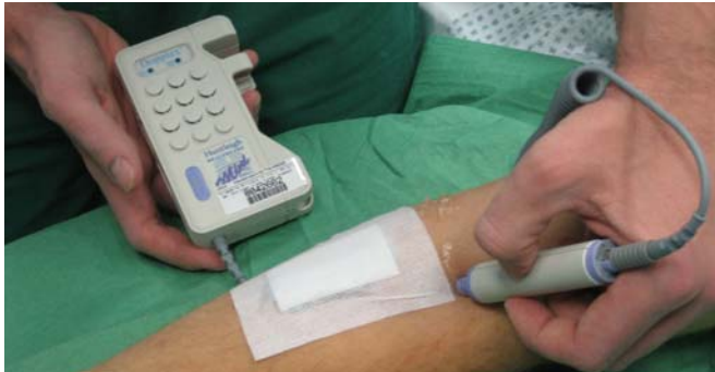
Funktionskontrolle nach Shuntanlage